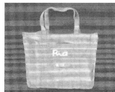
▲リサイクルバッグ