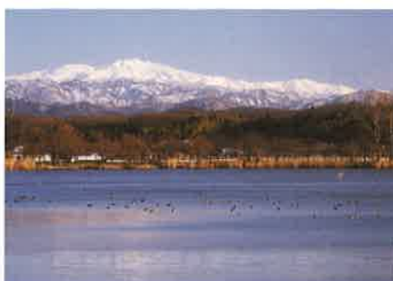
木場潟から見る白山