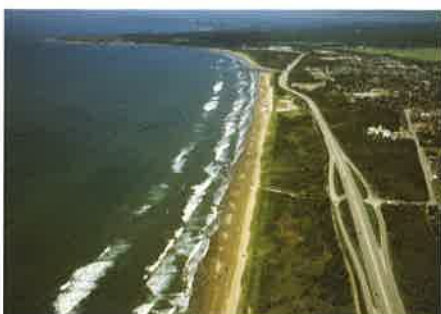
千里浜なぎさドライブウェイ

(株)商工組合中央金庫、(株)日本政策金融公庫、(独)中小企業基盤整備機構、(独)勤労者退職金共済機構、(独)高齢・障害・求職者雇用支援機構、(公財)全国中小企業取引振興協会、(一社)全国信用保証協会連合会、(有)エヌ・エス・エイサービス、(公社)石川県観光連盟、(一社)金沢市観光協会