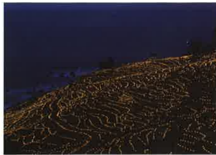
輪島白米千枚田あぜのきらめき