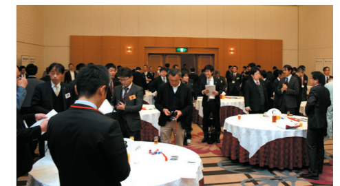
第2回企業交流会の様子(平成31年2月4日)

「ビジネスパートナー(発注企業)との面談コーナー」、「ものづくり実施事業者の展示PRコーナー」、「認定支援機関等の事業紹介コーナー」を設け、参加者(ものづくり補助事業者)はビジネスチャンス獲得に向け、新たな人脈・ネットワークづくりを行います。