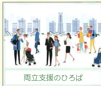
両立支援のひろば