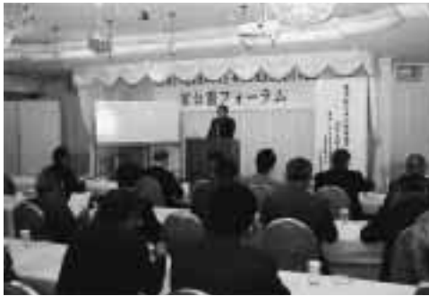
県官公需フォーラム

『県官公需フォーラム』は、従来の県関係部局担当者への要望・陳情から、小島秀俊岐阜県基盤整備部参与兼建設管理局长を招き、岐阜県の建設業界に対する取り組みをテーマに講演を行った。