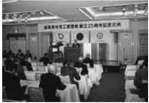
可児団地・25周年記念式典