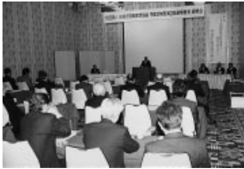
情産協の第2回通常総会

平成十三年度は、協会組織の拡充と財政基盤の強化、岐阜県の戦略的アウトソーシングにおける地域企業の受注確保、日本版CMM策定に係るソフトウェア開発・調達プロセスの改善に