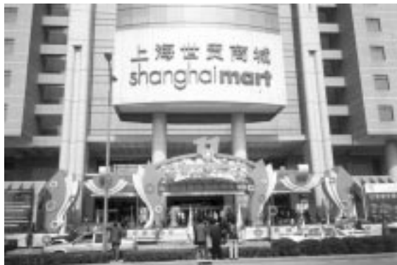
中国華東輸出入商品会会場の「上海世貿商城」

今年中にはWTO(世界貿易機関)に加盟する見込みの中国。WTO加盟後の上海経済は、一体どこまで発展するのか誰も想像出来ないが、少なくとも、21世紀の中国社会主义市场经济の中心であることは間違い無いだろう。