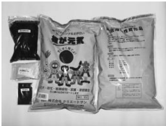
(株)クリエトサンが開発した炭化製品