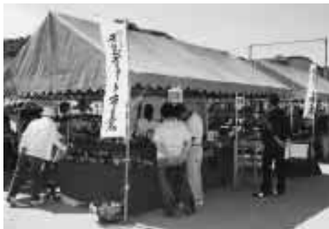
美濃焼産地PRイベント

また、各会場では陶磁器の廉売市や蔵出し市が行われたほか、産業観光の推進を意識して企画した焼き物の街を散策する窯元めぐりが好評であった。