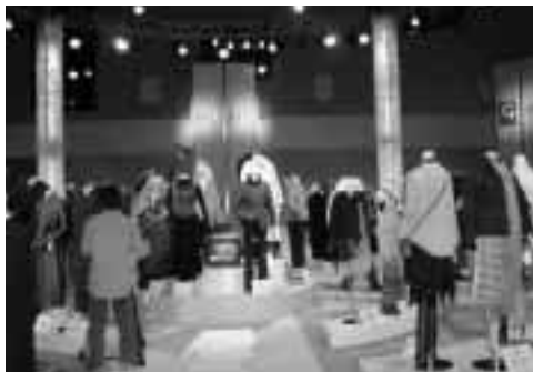
第43回岐阜ファッションフェア

国から集まったバイヤーにアピールした。 また、会場では、展示会で「良い」と感じたら即時にメーカーに連絡できる具体的な商品表示「バイヤーシート」に記入してもらいメーカー側からも連絡ができるようにする「バイヤー向け」インフォメーションデスク」の設置など工夫が施されていた。