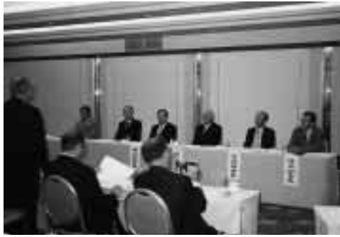
岡山県との意見交換会

会合では、双方が、両県の情報化の現状や各団体の活動概要を説明、意見交換では中国やインドのIT関連企業との連携事