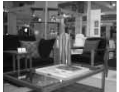
ライフスタイルを演出

今年には『飛騨のライフスタイル』をテーマに掲げ、組合関係者は「消費者に、飛騨といえ家具というイメージを持ってもらえるようなブランドにしたい」と話しており、その言葉通り今年も、展示方法に工夫を凝らし、展示場を家と見たてて、ある生活空間を演出した。