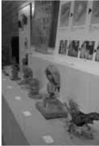
飛騨の伝統的工芸品・一位一刀彫