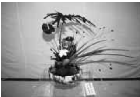
加藤卓男作の花器