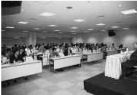
ベンチャーふれあいの場