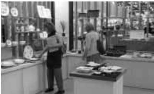
来場者で賑わう「みずなみ焼」ブース

この見本市に出展したフランクフルト出展PR委員会は、瑞浪市内の陶磁器関連6団体などから有志が結束し、2000年に発足した企業連合体。2月の「アンビエンテ」、8月の「テンデンス」からなる消費財専門見本市フラン