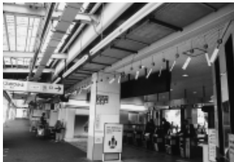
風に揺れる美濃焼風鈴

風鈴は、茶色のあめ釉(ゆづ)と緑色の織部釉の二色による民芸風のかめ型で、一千個を製作