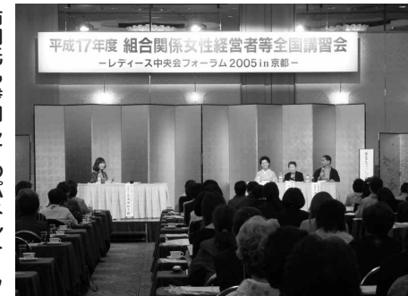
市田氏も参加してのパネルトーク