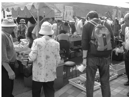
本町通りで大廉売市

同展示会は、既存製品の高付加価値化や新しい製品ジャンルの開拓への取り組みの成果を披露する場として開催し、展示PRによる需要喚起、美濃焼の一層の振興を図ることを目的に行われた。