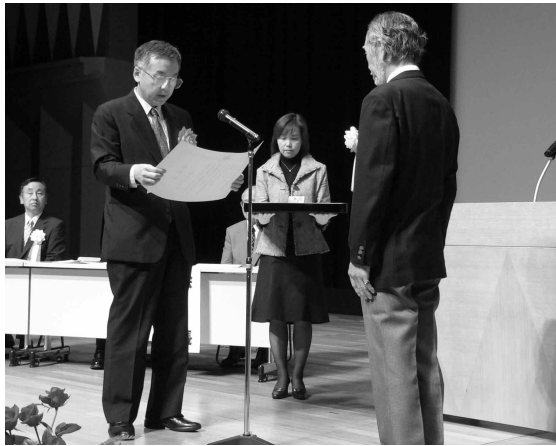
小川局長より表彰状の授与