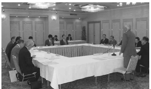
東海北陸ブロック中央会会長会議

高山市初田町2丁目32番地 ☎ 0577 32-3100 〒 506-0008 FAX 0577 34-8404