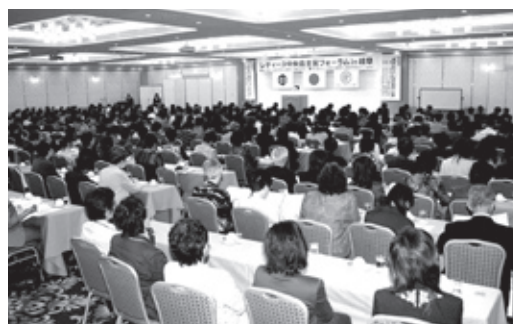
「レディース中央会全国フォーラムin岐阜」 於：岐阜グランドホテル H20.10.24

全国中央会と岐阜県中央会が主催し、全国レディース中央会と当レディースクラブが共催して、組合に関係する全国の女性経営者など約360人参加による「平成20年度レディース中央会全国フォーラムin岐阜」を開催しました。