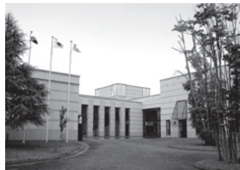
星3つの飛騨高山美術館

このように、高山は世界からも高く評価された観光地であるため、飛騨地域以外の方々も土・日曜日及び祝祭日の高速道路割引により、高山への観光もしやすくなったため、是非とも遊びに来て下さい。