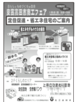
▲定住省エネチラシ