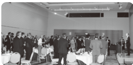
懇親会 乾杯の様子

今年度の中央会は、「組合ブランドを発信し、中小企業の地位向上を図る！」を支援目標に掲げ、組合という組織自体のブランド力向上を推進し、傘下中小企業等が持ち前の機動力を発揮し、その底力で多様に変化する環境に対応し、新たな活路を切り拓いていくための支援を行う。恒常的活動である巡回及び窓口相談等により把握した組合や中小企業者の事業ニーズに対し、柔軟かつ具体的な課題解決策を提案していく。また、組合等の経営基盤の強化を図るための事業として、専門家派遣、研修会実施の他、地域資源に着目した連携の発掘、人材確保、女性の活躍推進の事業について重点的に取り組む。なお、ものづくり補助金に係る地域事務局としての役割は継続して担う。