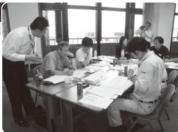
2回目のグループワークの様子

今年3月に中央会と東京海上日動火災保険(株)が締結した「地方創生に関する協定」の第一弾として、岐阜県鋳物工業協同組合が組合員企業向け事業継続計画(BCP)策定支援を行った。2回にわけて実施し、初回は5月26日に岐阜市内で、セミナー形式によりBCPの役割やBCP策定による効果、岐阜県で想定される地震被害予測などを学んだ。2回目は6月24日に各務原市内で、参加者がシュミレーションをしながらBCP策定に取り組んだ。参加者からは、「危機管理意識をもつことにより、日々の業務で見逃していた現状の問題点や課題が明確になり、業務改善にも役立った」といった感想が寄せられた。