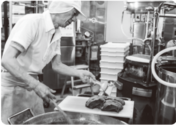
渡辺会長こだわりの自家製餡