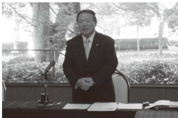
中小企業組合士協会総会であいさつをする市原会長

ぜひ、今年、組合士試験へのチャレンジを…。そして、1組合に1組合士が誕生しますように心から念じております。