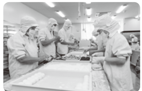
ひとつひとつ手作りされる「ふる一つ大福」

当社には餡を使った商品が沢山ありますが、全ての商品に同じ餡を使っているわけではありません。お菓子の美味しさをより引き立たせるには、それぞれにあった餡を用意する必要があります。そのため、当社では自社工場ですべての種類の小豆を炊いています。また、お菓子に使用する果物は、全て旬の素材にこだわり、その時に一番美味しい品を選定していますし、出荷にも細心の注意を払い、傷の有無や熟れ加減などの品質管理を徹底しています。そして、大粒の苺や栗、たっぷりのクリーム、餡、これらを柔らかい餅生地ですくもめあげるには、人の手で優しく慎重に包んであげるしかありません。ふわふわ食感を保ちつつ、見た目も綺麗に包み込む。この技術こそ、ふる一つ大福が誕生するずっと前から手作りにこだわって和菓子作りに励んできた「和菓子屋 養老軒」が培った財産なのです。手作りにこだわる分、人材育成には時間がかかります。ですが当社では、「面倒なことをやろう」を合言葉に、毎日丁寧なお菓子作りに努めています。手作りだからこそ、工場で作ったものを素早くお客様に届ける工夫をしなければなりません。直営店での販売をはじめ、社員による出張販売や工場直営の通信販売、百貨店での買取販売により、お客様に新鮮な味を届けています。