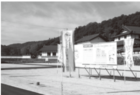
安芸高田市ブランド住宅「咲くら」

安芸高田市の風土、気候にあった住宅建築を実現すること、組合の検査規約による品質監査、完成検査等を十分に実施することで、顧客の地元工務店に対する信頼、イメージが向上。組合設立前より地元の事業者による新築住宅受注件数は伸び、長期優良住宅やゼロ・エネルギー住宅等省エネ住宅の施工実績を持つ会社は1社から4社へと伸長した。