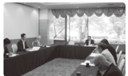
第40回総会で議案審議

中小企業組合士制度の詳細は全国中央会HPをご覧ください。検定試験は今年も12月に行われる計画となっており、本誌8・9月号で試験の案内を予定しています。